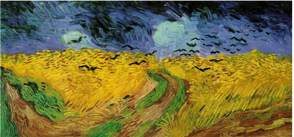
Korenveld met kraaien: Vincent van Gogh (1890)