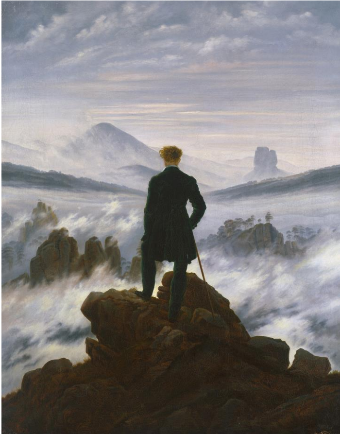
De wandelaar boven de nevelen: Caspar David Friedrich (1818)