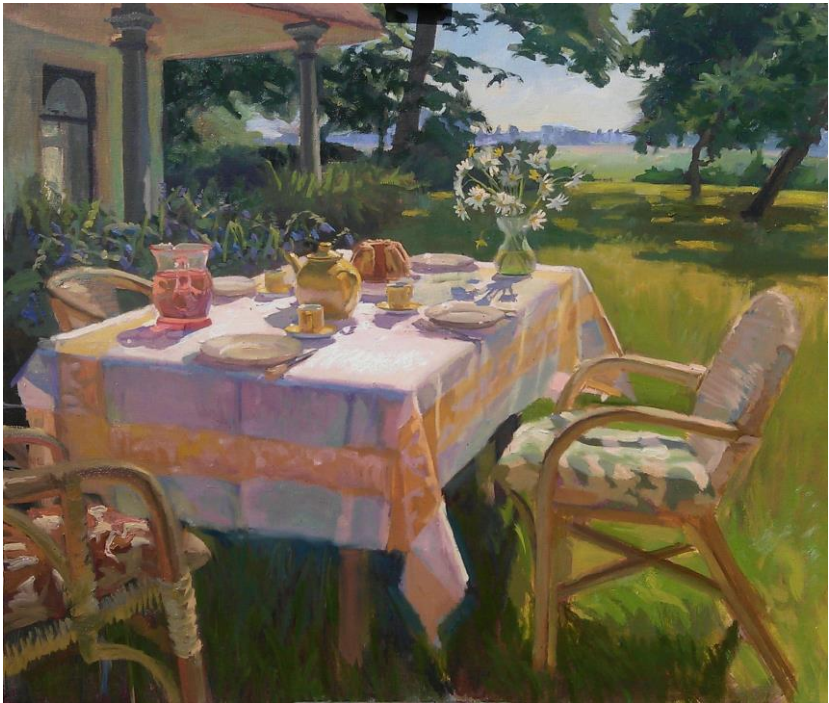
Gele tafel in de ochtendzon: Joost Doornik (2024)