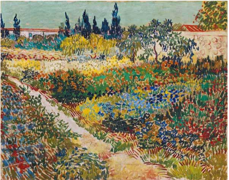
Tuin te Arles: Vincent van Gogh (1888)