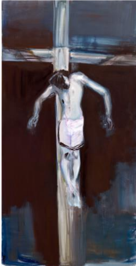
Ecce Homo: Marlene Dumas (2011)