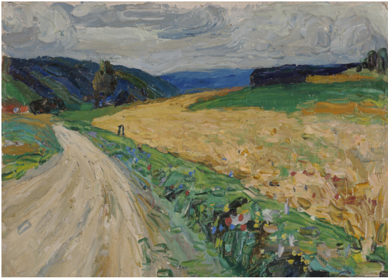
Weg door landschap: Kandinsky (1905)

maakt het schilderij spannend. De kijker is nieuwsgierig. Waar gaat die weg naar toe? Met je ogen dwaal je door het beeld en creëer je een verhaal. En laten we eerlijk zijn, wie wandelt er nu graag langs de snelste route van A naar B?