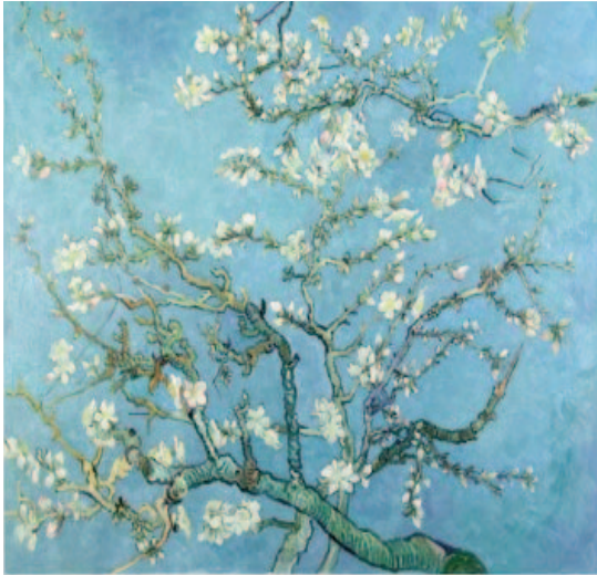
Amandelbloesem, Vincent van Gogh

Iemand die weinig geluk in zijn leven heeft gekend was Vincent van Gogh. Een paar maal ziet hij licht in de duisternis van zijn depressies. Wanneer hij hoort dat zijn broer een zoon heeft gekregen en die naar hem vernoemd, is hij voor even gelukkig. Hij verbeeldt zijn geluk door het schilderen van een tak vol amandelbloesem. Teken van nieuw leven, toekomst, geluk. In een brief aan zijn broer schrijft hij: 'Ik ben dadelijk begonnen een schilderij voor hem te maken... Grote takken witte amandelbloesem tegen een blauwe lucht... Deze laatste dagen hadden wij hier nogal triest weer, maar vandaag was het een ware lentedag, en de velden jong koren met lila heuvels in 't verschiep zo mooi, en de amandelbomen beginnen overal te bloeien.'