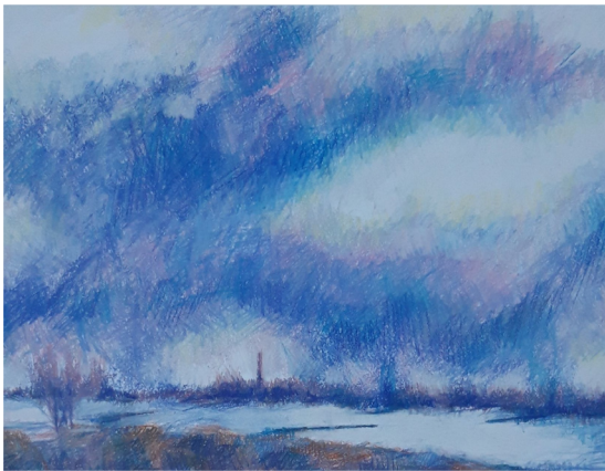
Landschap in de kijker

Landschappen zijn in de afgelopen eeuwen een bron van inspiratie voor veel schilders geweest. De Coronatijd was een uitgelezen periode om buiten in en naar de natuur te werken. In de omgeving van Hilversum, waar ik woon, vind je bossen, heidevelden en polders met waterrijke gebieden. Ze zijn mijn inspiratiebron. Maar ook het rivierenlandschap rond de IJssel en in de Betuwe. De lichtval op het water, de hoge luchten en het veranderende licht over het landschap zijn een uitdaging om te vangen in compositie en kleur.