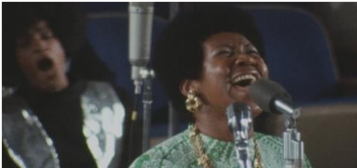
Film Amazing Grace met Aretha Franklin