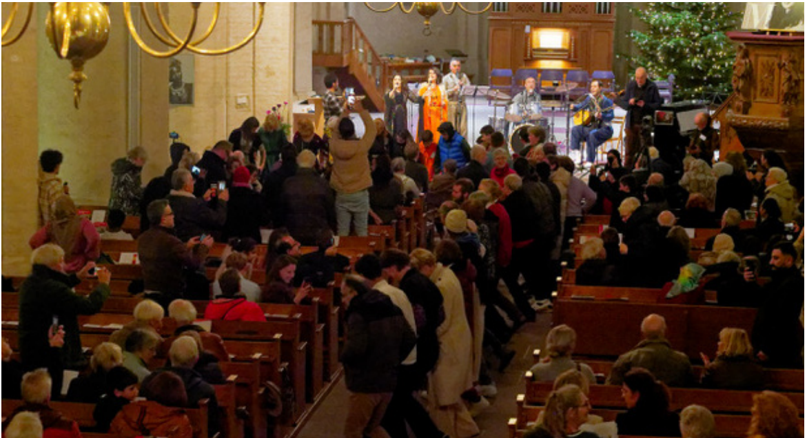
Dansen in het middenpad

het concert. Dat is toch wat lastiger dan het op het eerste gezicht lijkt. Maar al snel blijkt dat de informatie begint rond te zingen binnen de vluchtelingen gemeenschap. Resultaat: op 8 december om ongeveer 17.30 uur stroomt De Ruimte vol met gasten. De kookgroep heeft de nodige soep en hapjes gemaakt/ingekocht. Maar ook de bezoekers nemen grote schalen met allerhande lekkers mee. Onder de bezielende leiding van Ina worden de schalen over de verschillende buffettafels verdeeld. In De Ruimte ontstaat een uniek gebeuren van allerhande culturen en talen. Omstreeks 150 gasten, waarvan ongeveer 100 vluchtelingen genieten, praten, spelen en eten met elkaar. 'Ik heb me in twee jaar niet zo veilig gevoeld' meldt een van de bezoekers aan Jeroen.