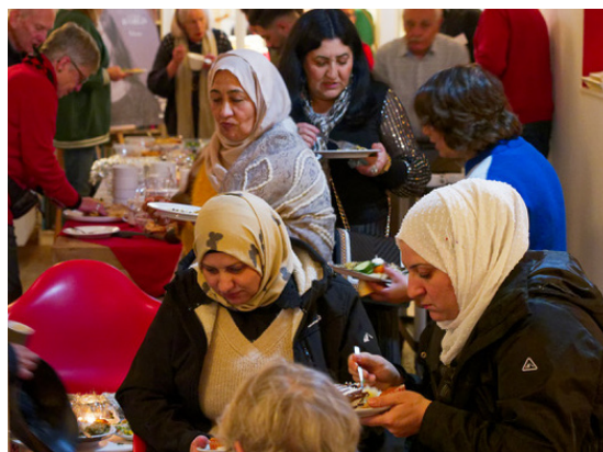
Laat het je smaken

Vóór het concert op 8 december eten we samen met vluchtelingen in De Ruimte. In overleg met Vluchtelingenwerk en met vertegenwoordigers van de Crisis Noodopvang worden vluchtelingen benaderd om deel te nemen aan de maaltijd en