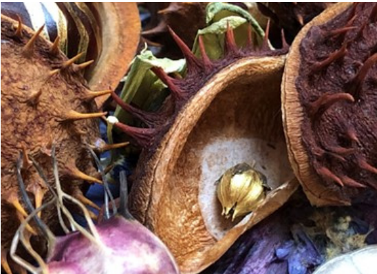
Kunstwerk op de cover van de paasgroetenkaart 2023: 'het graf is opengebroken'

Het ontvangen van een paasgroet doet goed. Gevangenen realiseren zich dat er mensen zijn die zich inleven in hun situatie. 'De vrouw die dit geschreven heeft, kent mij helemaal niet en toch krijg ik deze kaart,' was de verbaasde reactie van een vrouwelijke gedetineerde toen ze een paasgroet ontving.