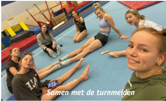
Samen met de turnmeiden

nationaal niveau turnen en mijn passie voor deze sport volledig na streven. In Canada realiseerde ik me echter in de tweede week dat de taal en de onderwijsstijl een aanzienlijke aanpassing zouden zijn. Ik herwon motivatie om daadwerkelijk te 'studeren' en veel materiaal te leren. Bovendien kon ik in St. Johns doorgaan met turnen bij een club die me hielp een prachtig programma op te bouwen na een blessure. Ook hier heb ik een hechte groep meiden ontmoet, en heb ik nog steeds contact mee. Samen met hun heb ik op mijn laatste avond 'Secret Santa' gevierd (een soort sinterklaasfeest).