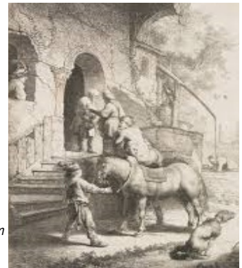
Barmhartige Samaritaan Rembrandt van Rijn (1633)