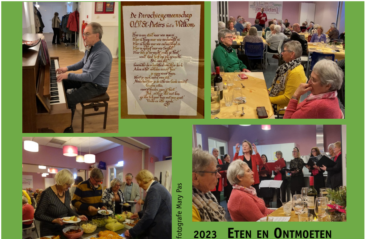
2023 ETEN EN ONTMOETEN