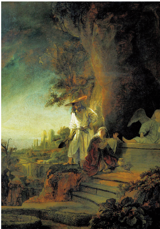
Maria Magdalena van Rembrandt

Als ik aan Pasen denk, dan denk ik altijd aan een beroemd schilderij van Rembrandt dat hij maakte van de Opstanding, volgens het Johannesevangelie (Johannes 20). Misschien kent u het. Op het schilderij zie je Jezus en Maria van Magdala die elkaar ontmoeten in een mooie tuin. Jezus heeft een grote flaphoed op, loopt met een schep rond en draagt een snoeimes dat Hij zo vanuit zijn riem kan pakken om wat rozen af te knippen. Hij is duidelijk een tuinman. Precies degene van wie Maria denkt dat Jezus is. Het grappige van dit schilderij is dus dat Rembrandt de gedachte van Maria heeft afgebeeld: Jezus is een aardse gestalte die je zomaar tegen het lijf kunt lopen en met wie je kunt praten, die je vragen kunt stellen, die jou antwoord geeft, of als het moet wat stekelige takken voor je wegsnijdt.