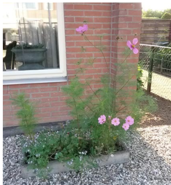
Groetjes Sofie van Elk