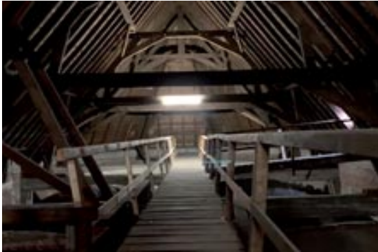
De zolderruimte boven de gewelven

Als we u nieuwsgierig hebben gemaakt laat het ons weten, we zoeken nog iemand die een film of blog kan maken van alle ruimten boven in de kerk en de toren. We maken dan de beklimming voor u ook zichtbaar.