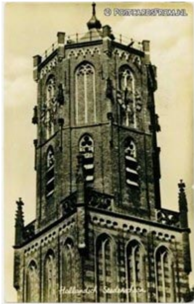
Torenspits van voor de oorlog

De bouwstijl van de kerk stamt uit de late Nederrijnse gotiek. De kerk heeft een schip met twee beuken een toren en een koor. De toren heeft drie inspringende geledingen waarvan de onderste twee geledingen een vierkant grondplan hebben, de bovenste geleding is achtzijdig. Op de top bevindt zich een korte achtzijdige torenspits met een peervormige bekroning.