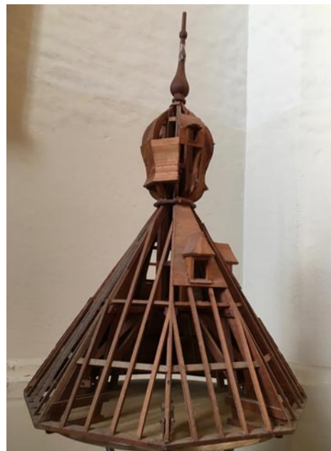
De spanten van de torenspits

De klim tot de eerste torenvloer is via de stenen spiltrap die een touw heeft als 'leuning', daarna gaan we via open houten trappen tot bovenaan. De beklimming vraagt enige 'trittsicherheit en schwindelfreiheit' zou men in de bergen zeggen en daarnaast is enige conditie wel wenselijk.