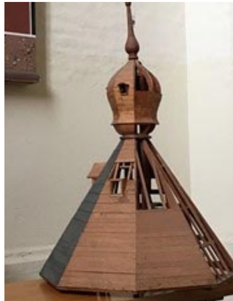
De spits met houten bekleding

De torenhal is de toegang tot de kerk, de overige ruimten van de toren worden niet gebruikt. Via de trappen heeft men toegang tot de orgelkamer en de gewelven boven het schip en koor, ook is dit de toegang tot de eerste torentrans. Gaan we verder de toren op dan komen we bij de torenruimten op 14 en 19 meter hoogte. De volgende vloer is op 27 m hoogte hier staan de 3 luidklokken opgesteld, dit is een open ruimte met schalmgaten. Op 35 m hoogte staat het uurwerk met de aandrijving van de wijzerplaten op de buitenzijde van de toren. Daarna komen we op de vlaggenzolder op 42 m en de omloop van de bovenste torentrans en de torenspits. Dit is de werkvloer van waaruit het 'vlaggenilde' de 4 vlaggen uitsteekt bij feestelijke gelegenheden. De twee foto's van het model geven heel mooi aan hoe de houten constructie is opgebouwd, de torenspits is bekleed met natuursteen leien en de peervormige afdekking heeft een loodbekleding.