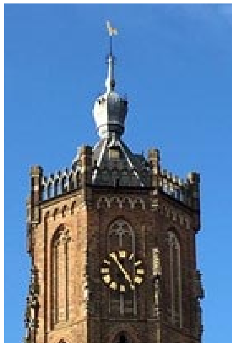
Torenspits anno 2021

De aanleiding om eens in de pen te klimmen is een contact met de Rijksdienst voor Cultureel Erfgoed voorheen de Monumentenzorg. Zij waren in het bezit van een model van de torenspits zoals die bij de restauratie van de kerk na de oorlog is gebouwd, zij stelden deze aan ons ter beschikking. We zijn dus nu in het bezit van dit model. Voorlopig heeft het een plaats in de torenhal, we denken nog na over een passende plaats in de kerkruiimte. De twee foto's van de torenspits geven de situatie aan van voor de oorlog en de situatie van na de restauratie.