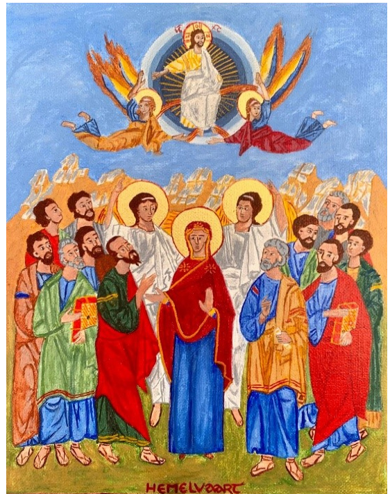
Hemelvaart van Jezus

Elke eerste zondag van de maand is er een oecumenische ademviering in de Grote kerk te Elst, van 19.00 tot 19.45 uur. Een viering, zoals de naam het al zegt, om op adem te komen, om de stilte te zoeken, te luisteren naar een Bijbeltekst, een gedicht.