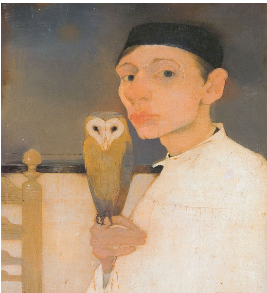
Zelfportret met uil: 1911

Om in deze chaotische wereld vol veranderende politieke verhoudingen zoekt Mankes rust in het schilderen van het 'eenvoudige'. Toch proef je in zijn schilderijen de zwaarte en donkerte van deze tijd. Veel van zijn landschappen zijn gesitueerd in de avondschemering. De tijd tussen dag en nacht, de periode van overgang van de ene naar de andere tijd is overal voelbaar. Een tijd van transitie.