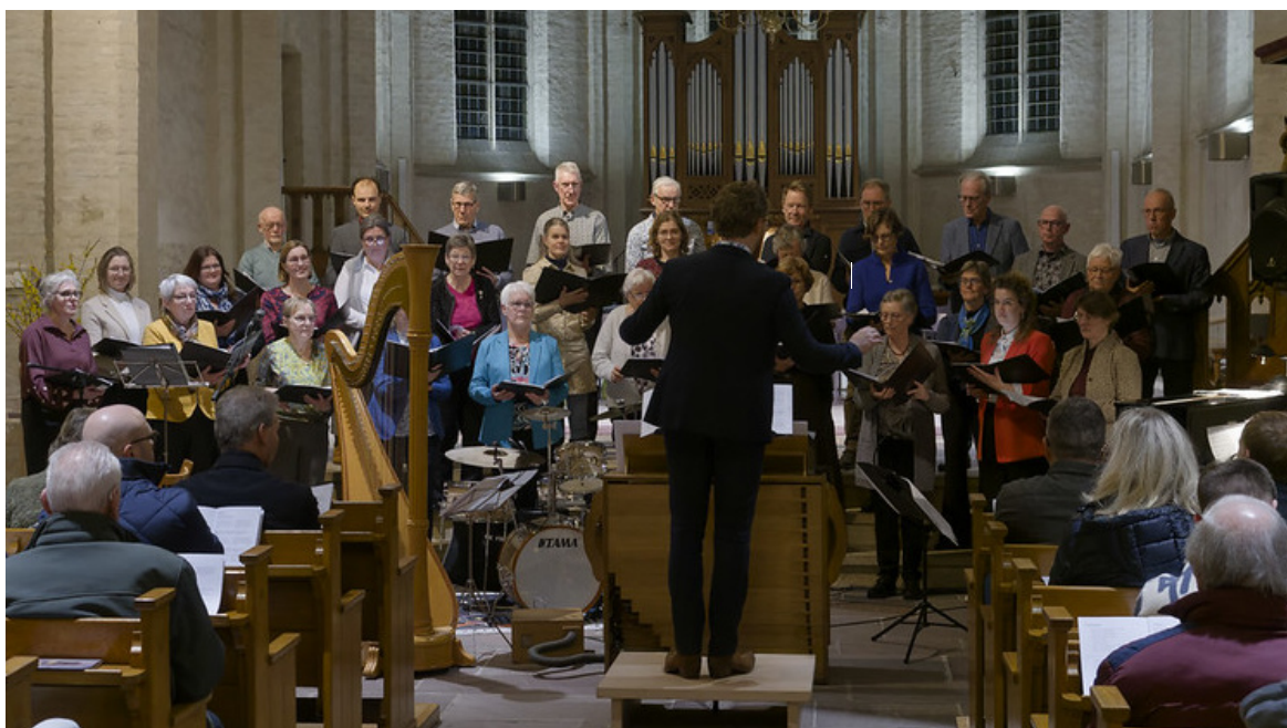
Projectkoor G-noot in actie