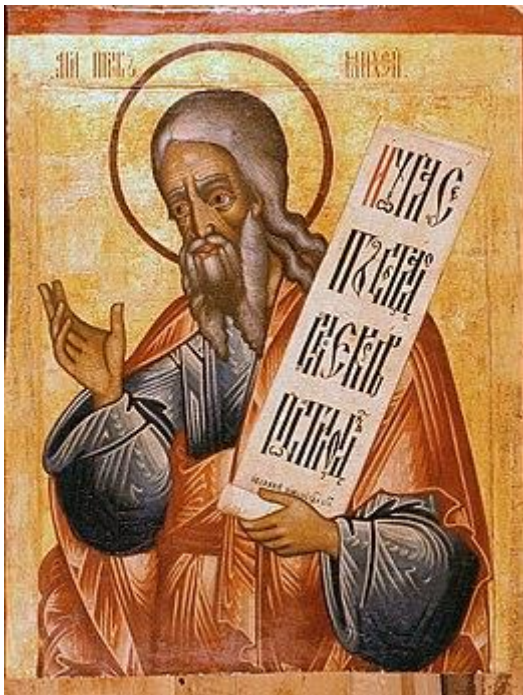
Icoon: De profeet Micha